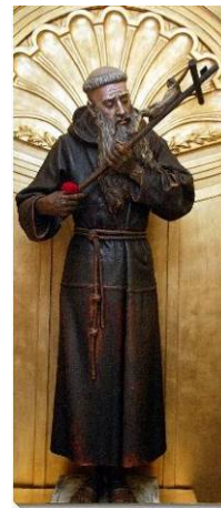
Imagen del Beato Diego José de Cádiz entronizada en la hoy llamada capilla de los Beatos de la Basílica de Nuestro Padre Jesús del Gran Poder de Sevilla