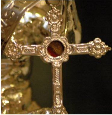
Reliquia del Beato Fray Diego José de Cádiz