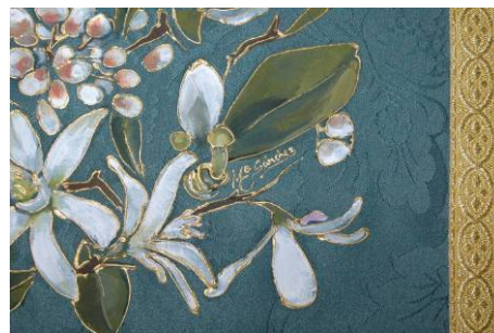
Detalle de la orla