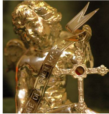
Angel con cruz-relicario