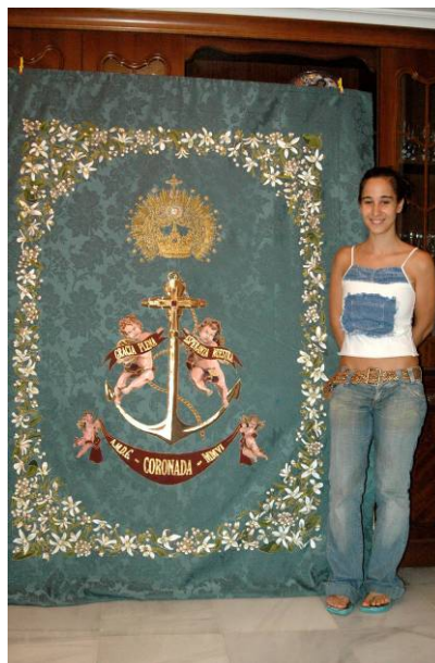
La autora junto a su obra